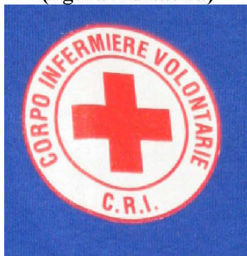
Fig. 4 (figura indicativa)