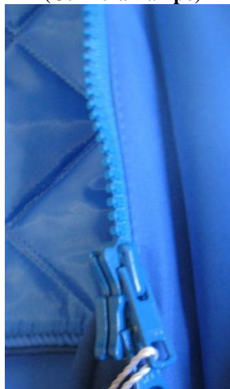
Fig. 9 (Cerniera Lampo)