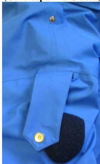
Fig. 8 (Controspallina Giacca)