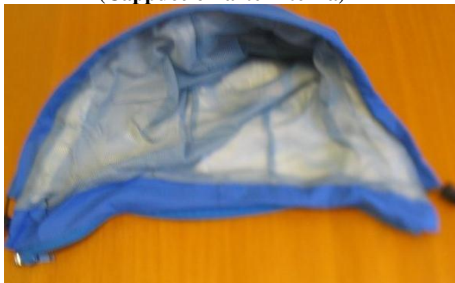
Fig. 5 (Cappuccio Parte Interna)