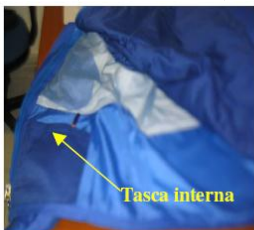
Fig. 1 (Parte Interna Giacca)