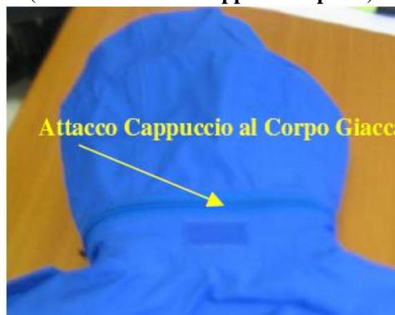
Fig. 3 (Parte Posteriore Cappuccio Aperto)