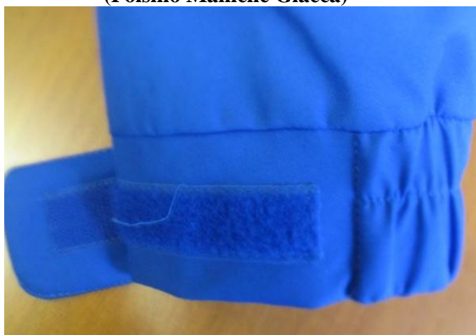
Fig. 6 (Polsino Maniche Giacca)