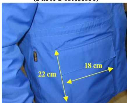
Fig. 11 (Parte Posteriore)