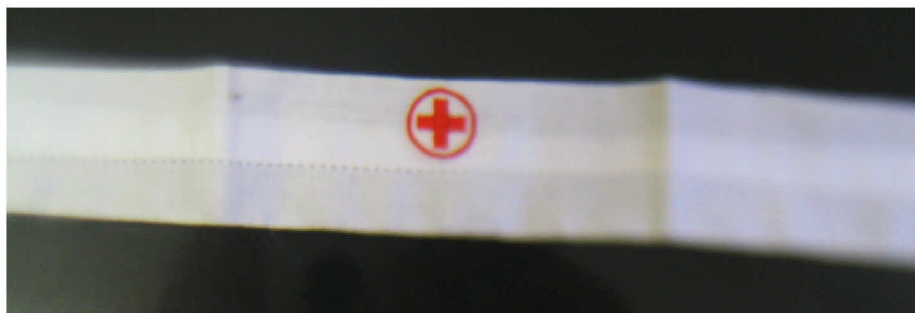
Fig. 1.2 (Vista anteriore per Croce ed Orlo a giorno)